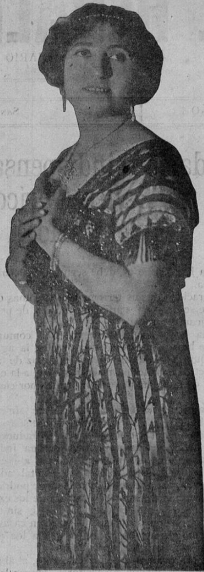
La eminente soprano lírica Cornelia Zuccari

R ECORDAMOS a los Agentes Viajeros y al comercio en general, que en el Hotel América de Alajuela encontrarán un esmerado servicio de bestias de alquiler. (Precios rebajados). Por el teléfono N° 1 pueden dictar órdenes.